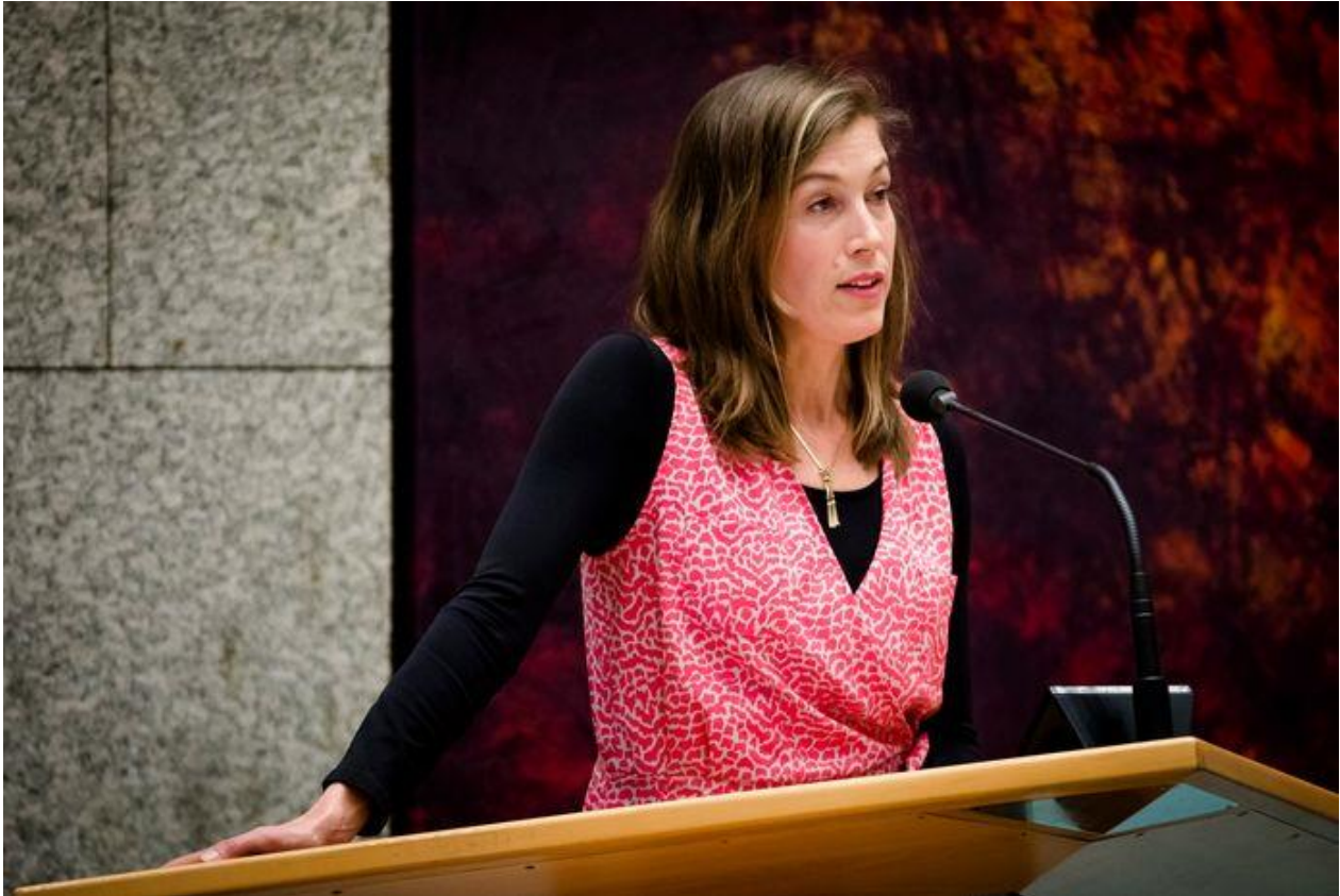
Tweede-Kamerlid Corinne Ellemeet (GroenLinks).

Ellemeet onderzoekt hoe Pfizer toch gedwongen kan worden af te zien van het patent. „Dat kan bijvoorbeeld door middel van een dwanglicentie. Nu is dat een procedure waar maanden overheen gaan. Kostbare tijd die we tijdens deze crisis niet kunnen verliezen. In landen als Duitsland, Canada en Frankrijk zijn ze al bezig wetgeving daarop aan te passen, zodat zo'n licentie sneller verstrekt kan worden. Dat moet hier in Nederland ook kunnen, maar de regering lijkt geen actie te willen nemen.”